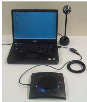
PCとの接続イメージ